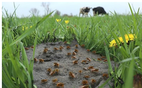
VLAAI VOL LEVEN